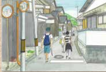
横防 岡崎 貢さんの作品 「観光客の姿が見えます」