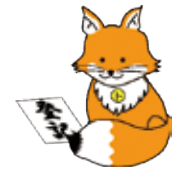
不動産登記推進 イメージキャラクター 「トウキツネ」

身の回りの不動産を確認し、 速やかに相続登記を行えるよう、今のうちから備えましょう!