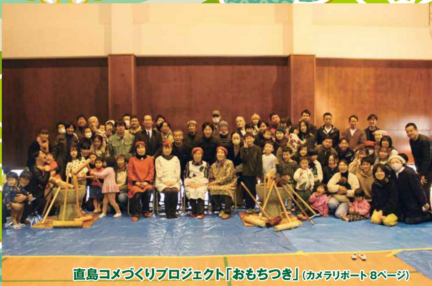
直島コメづくりプロジェクト「おもちつき」(カメラリポート 8ページ)

町の人口 | 1月1日現在(先月比) 世帯数/1,574(+2) 人口/2,947(-2) 男/1,524(±0) 女/1,423(-2) 住民基本台帳法の一部を改正する法律により、人口は、外国人の方を含めた人数となっています。