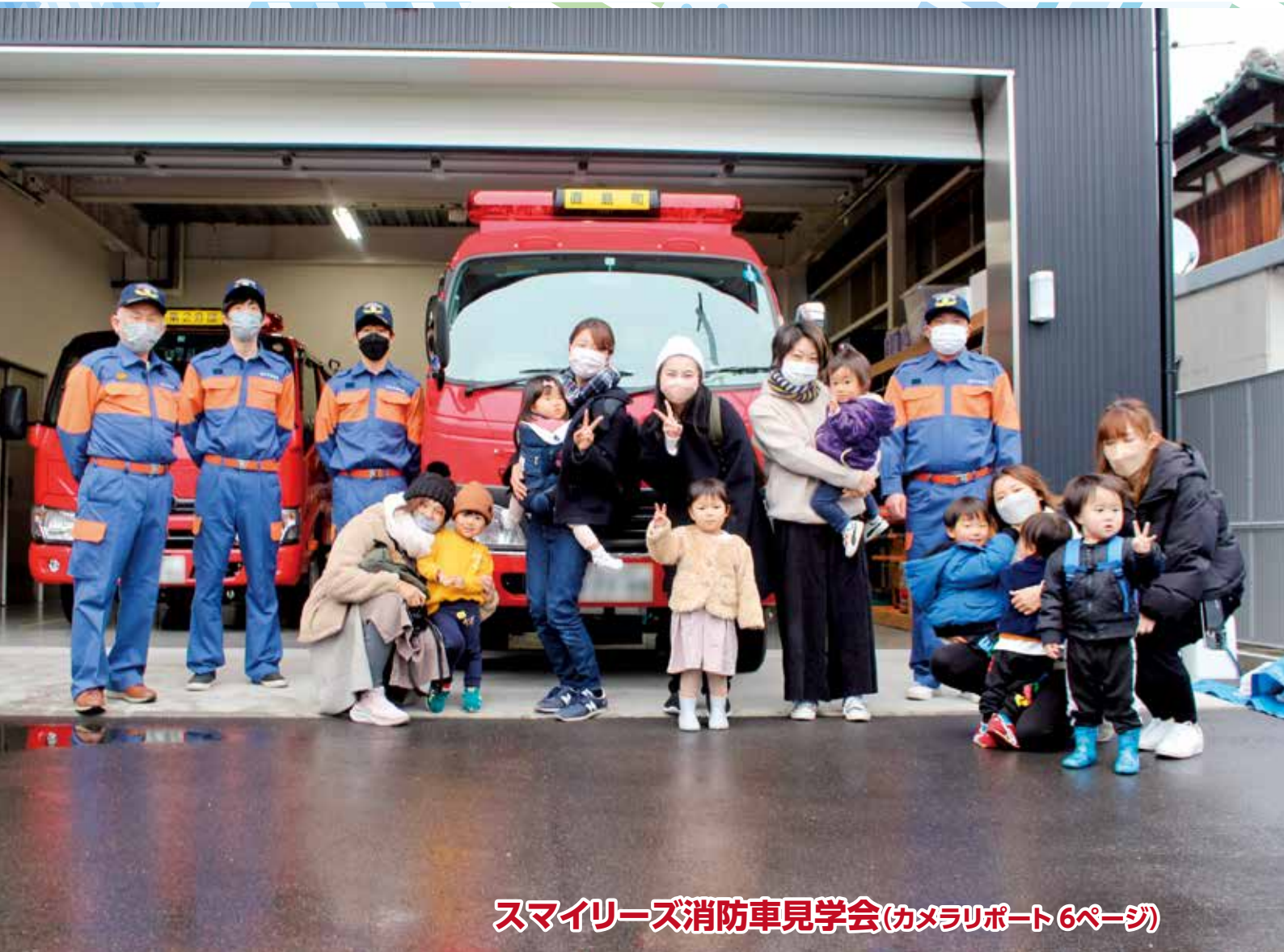
スマイリース消防車見学会(カメラレポート6ページ)

町の人口 | 3月1日現在(先月比) 世帯数/1,543(-5) 人口/2,940(-9) 男/1,520(-8) 女/1,420(-1) 住民基本台帳法の一部を改正する法律により、人口は、外国人の方を含めた人数となっています。