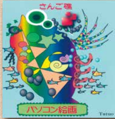
積浦 佐義 達雄さんの作品 「さんご礁」