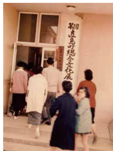
第2回文化展（文化祭）の風景（昭和36年）

お問い合わせ・お申し込み 教育委員会 ☎087-892-2882 FAX 892-3888