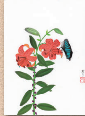
オノ神 麻生 京子さんの作品 「鬼百合」