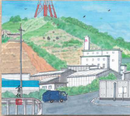
横防 岡崎 貢さんの作品 「直島町クリーンセンター」