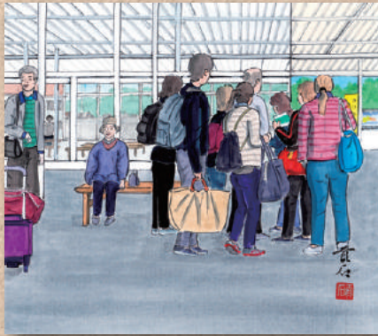
横防 岡崎 貢さんの作品 「港は外国人観光客でいっぱい」