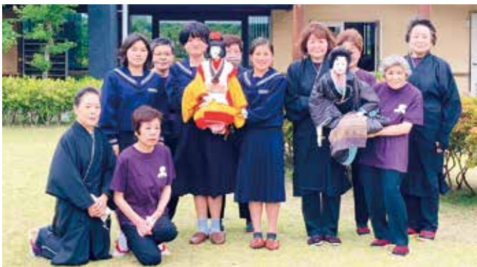
子ども座と人形遣いの座員