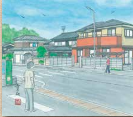
横防 岡崎 貢さんの作品 「本村」