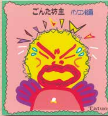
積浦 佐義 達雄さんの作品 「ごんた坊主」