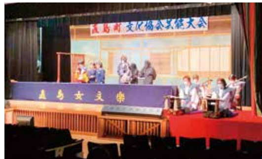
6月の芸能大会での公演（福祉センター）