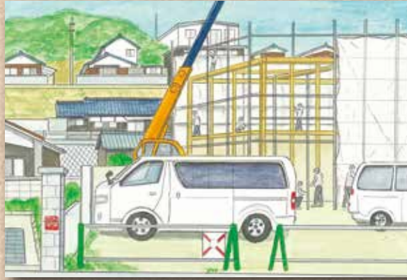
横防 岡崎 貢さんの作品 「町営住宅建設中」