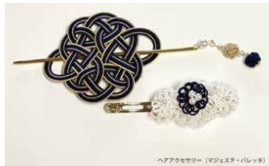
ヘアアクセサリー (マジェスタ・パレット)