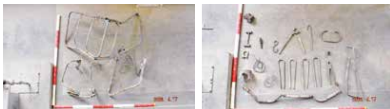
※実際に混入されていた未燃物となった金属(写真中の赤白は20cm間隔)

また、明らかに事業系からの混入と推測できる不燃物(金属類)も多く、焼却施設の長寿命化および安全に運用するために、「金属混入の防止」と「分