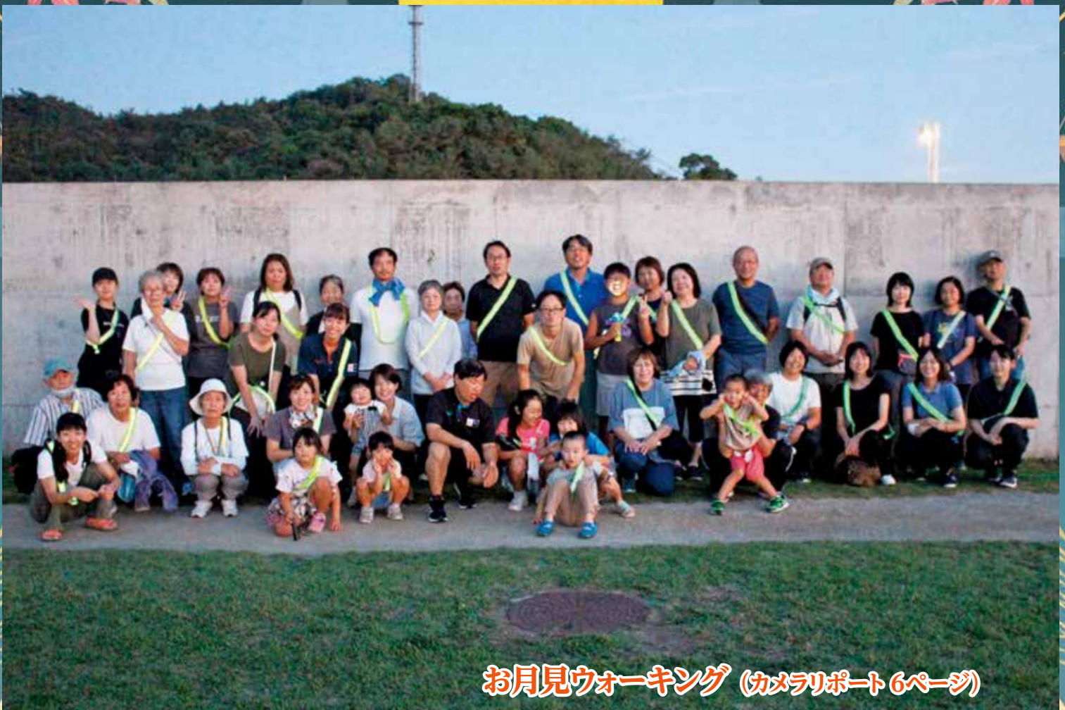
お月見ウォーキング (カメラリポート 6ページ)

町の人口 | 10月1日現在(先月比) 世帯数/1,572(+5) 人口/2,954(+3) 男/1,525(+4) 女/1,429(-1) 住民基本台帳法の一部を改正する法律により、人口は、外国人の方を含めた人数となっています。