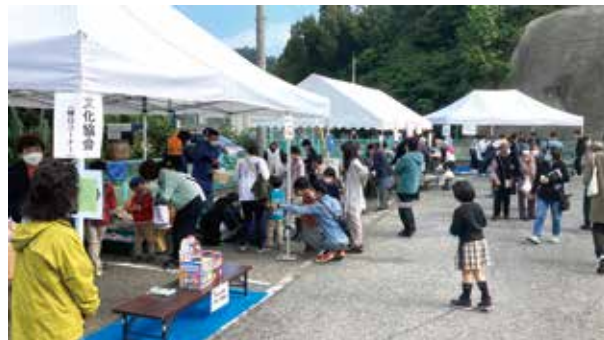
前回(令和4年度)のようす

作品の出展を希望される方は、申込用紙を教育委員会事務局(役場2階)・西部公民館・総合福祉センターにそれぞれ置いてありますので、 10月11日(水)【必着】 までに教育委員会事務局へ申し込んでください。