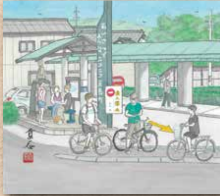
横防 岡崎 貢さんの作品 「役場前」