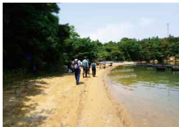
遺跡の分布調査のようす