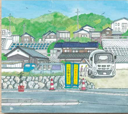
横防 岡崎 貢さんの作品 「家の前の道路工事」