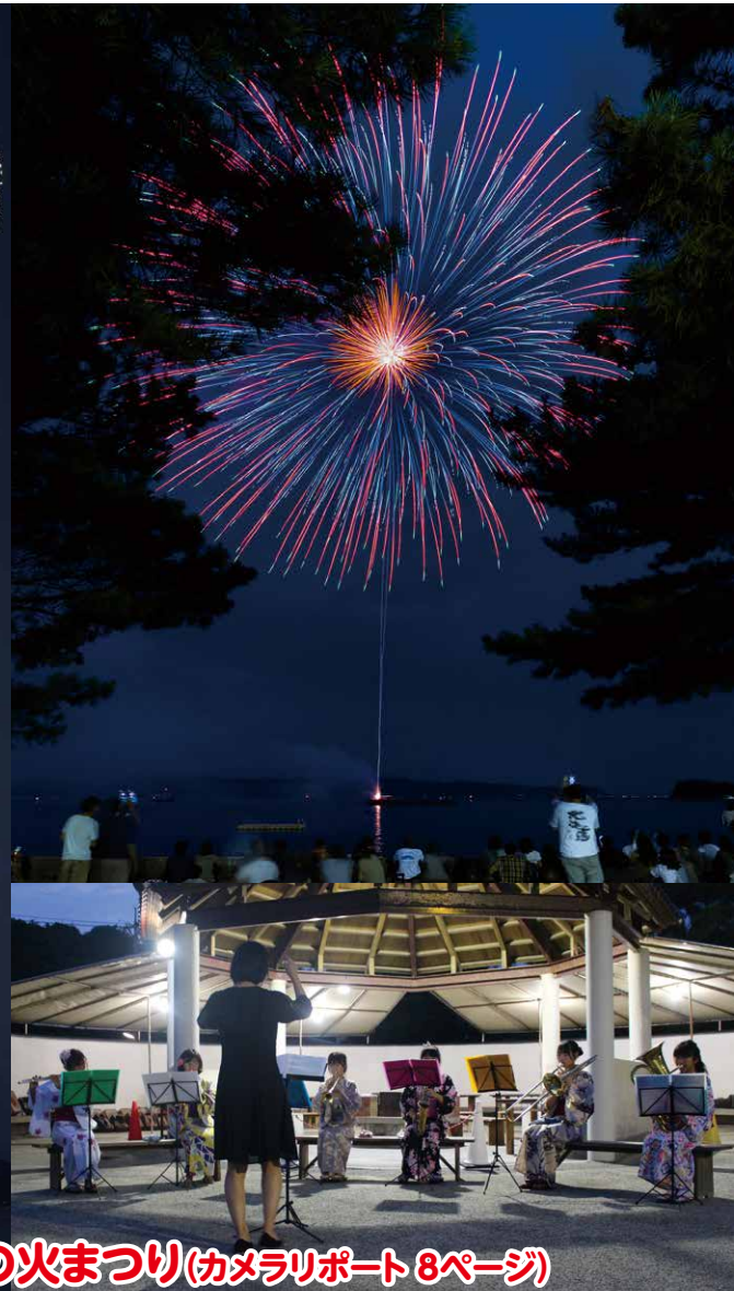
直島の火まつり(カメラレポート 8ページ)

町の人口 | 9月1日現在(先月比) 世帯数/1,575(+3) 人口/3,002(+2) 男/1,561(+2) 女/1,441(±0) 住民基本台帳法の一部を改正する法律により、人口は、外国人の方を含めた人数となっています。