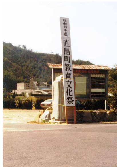
昭和55年教育文化祭の風景

作品の出品を希望される方は、 10月12日(水)【必着】 までに教育委員会へ申し込んでください。 申込用紙は教育委員会（役場2階）・西部公民館・総合福祉センターに置いてあります。