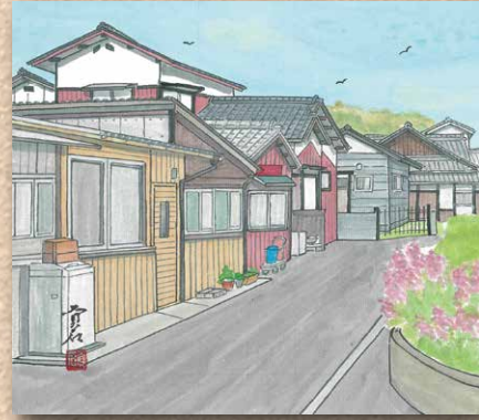
横防 岡崎 貢さんの作品 「西部公民館裏の景」