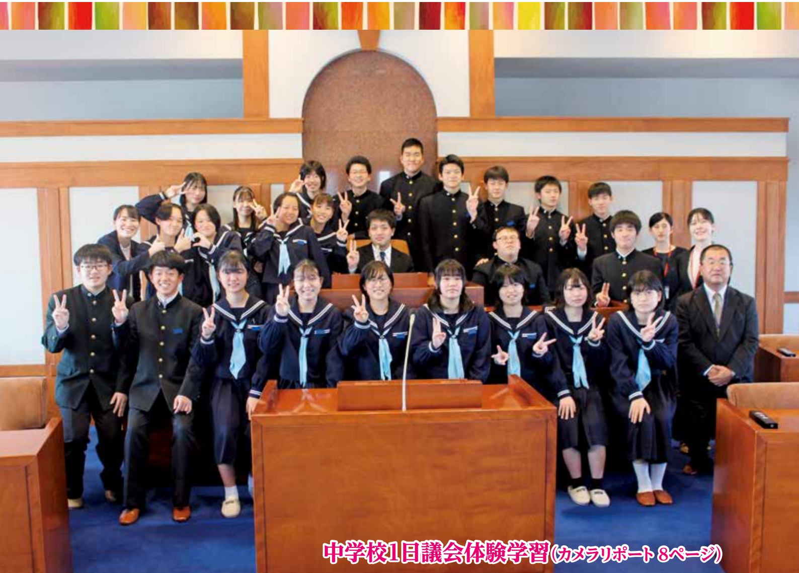
中学校1日議会体験学習(カメラリポート8ページ)

町の人口 | 12月1日現在(先月比) 世帯数/1,572(-1) 人口/2,949(-1) 男/1,524(+1) 女/1,425(-2) 住民基本台帳法の一部を改正する法律により、人口は、外国人の方を含めた人数となっています。