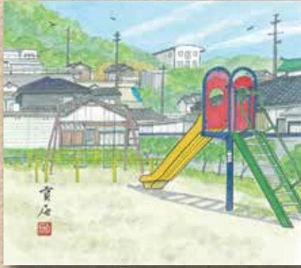
横防 岡崎 貢さんの作品 「横防公園すべり台」