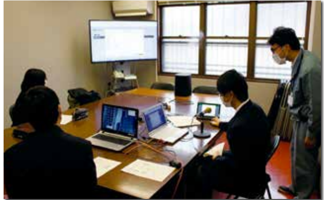
ふれあい通信の配信作業を体験中…。