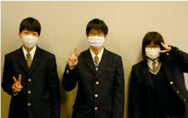
今回、参加した玉野高校の生徒さん達

直島町役場で玉野高校の生徒が二日間職場体験学習を行いました。一日目の体験では生徒たちは直島町役場のそれぞれの課の仕事内容について教えてもらったり、町の歴史について改めて学んだり、災害が起きた場合に役場の職員はどういった行動や対応をとるべきかなどを考えてもらいました。二日目はふれあい通信なおしまの放送を体験したり、SNSに体験の様子をアップロードしたり、広報紙を実際に作ってもらいました。生徒は「細かいところまで直島町について考えて仕事をしているところや、議会を通してそれぞれの課が話し合うことで町がよりよくなっていくから町民が安全に楽しく過ごせているのだなと思いました。」と言っていました。