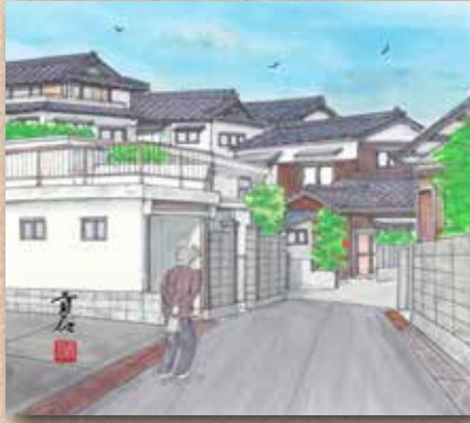
横防 岡崎 貢さんの作品 「石場町の景」