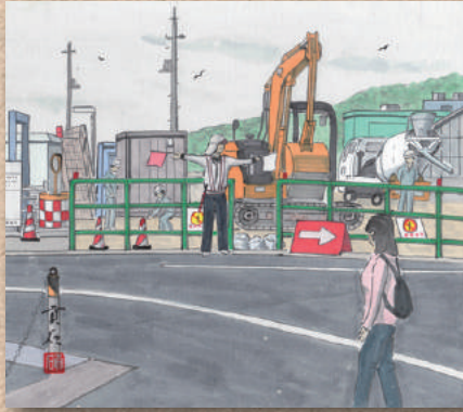
横防 岡崎 貢さんの作品 「排水ポンプ場工事中」