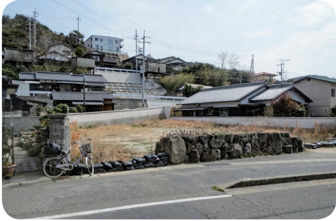
横防に家族用住宅建設予定

A (町長) 解体は予算等も考え、早くて来年予定。また、跡地利用はまだ決めていない。今後、十分に検討する。