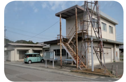
旧積浦集会所と第2分団屯所跡地は

A (町長) 執行部と口が増えるのか、全員が取り組まねばという意志表示だ。議員からいろいろなご意見がいただければありがたい。