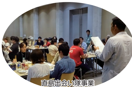
直島出合い隊事業