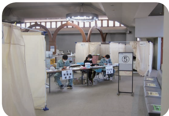
3回目のワクチン接種

A (教育長) 幼児学園、小学校、中学校の今年度の経営報告があった。中学校では、英検3級、2級の合格率が64%達成している。県の平均は50%なので、直島は多くの生徒が合格している。