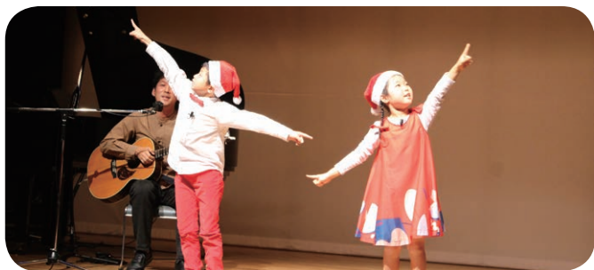
今年はできた きらめき音楽会