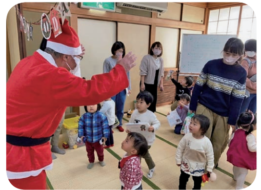
教育長がサンタに

し、よりきめ細かい授業をすることも少人数指導と呼ぶが、直島の場合すべて35人以内のクラスとなっている。