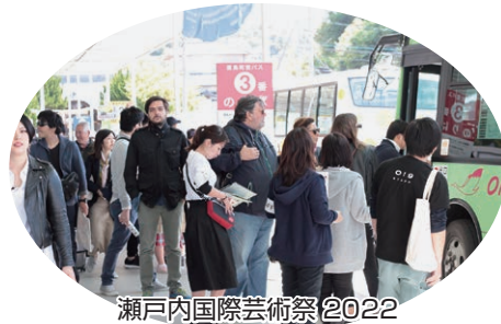
瀬戸内国際芸術祭2022