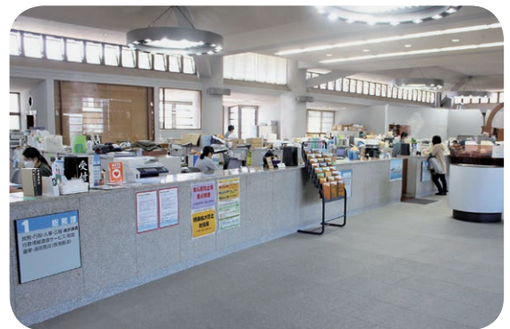
もっとわかりやすい案内表示を