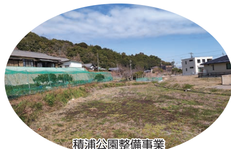
積浦公園整備事業