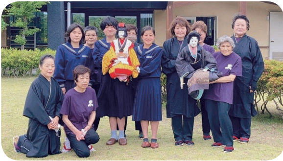
女文楽の後継者育成が必要

A (町長) 町民の要望があった。また、宅地造成地の残地もあるので、姫宮団地横に決定した。中に一部買収地もある。