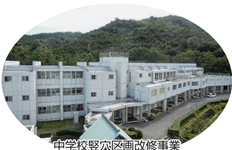
中学校堅穴区画改修事業