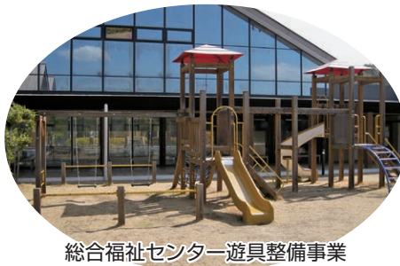
総合福祉センター遊具整備事業