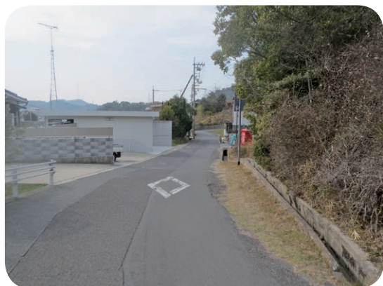
修繕が待たれる路面段差