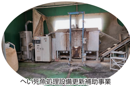
へい死魚処理設備更新補助事業