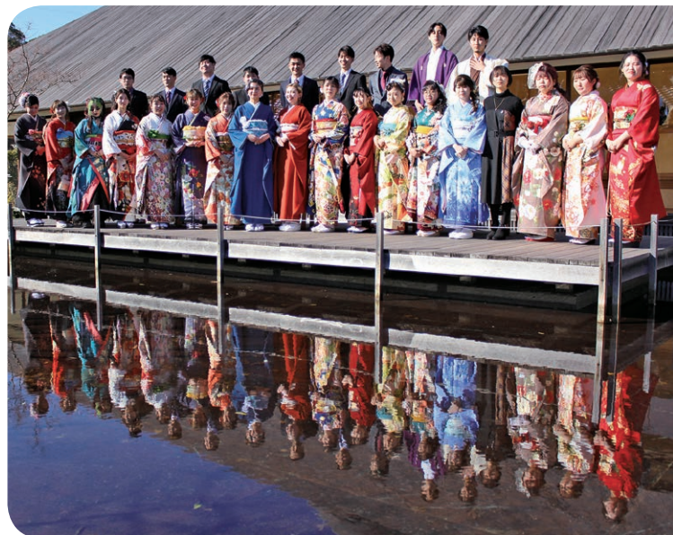
今年も華やか成人式