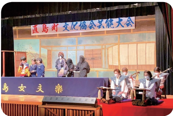
がんばっている女文楽子ども座

を実施。小学校では6年生の授業において、加配の先生、担任、ALTの3人体制で実施している。