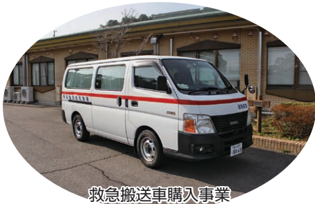
救急搬送車購入事業