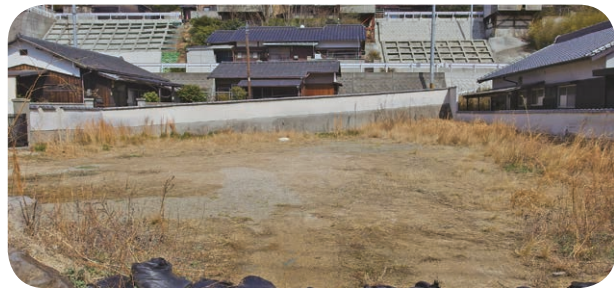
横防家族用住宅建設予定地

〔町長〕 来年度に空き家を活用したい方や空き家の所有者を対象にした個別の相談会を町内の集会施設で数回開催したい。その相談会の中で「定期借家制度」