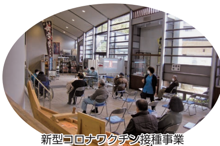
新型コロナワクチン接種事業