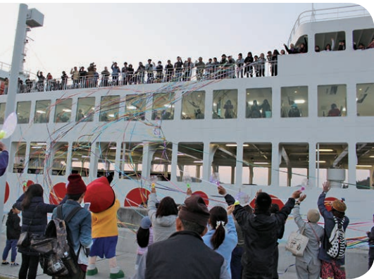
盛大だった2019 瀬戸芸

での感染状況はまだまだ予断を許さない状況だ。先日の実行委員会本部会議において、県・市の対処方針を基本的指針として、感染拡大予防ガイドラインに基づき、ケース別・島別で適切に対応するとしている。また、感染状