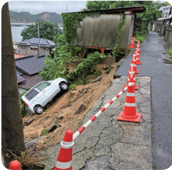
横防がけ崩れ現場

常任委員会で、長きにわたり議員定数について議論を続けてきました。 減ずることによるメリット・デメリット等、各議員の考え方や意見をたたかわせてまいりましたが、当町の実態に照らし合わせ、9人が適当であると判断し、賛成多数で改正することに決定しました。