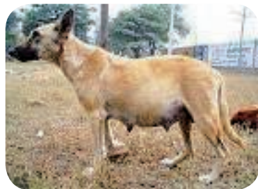
野良犬を発生させないために…

な課題であり、今後も医師の確保を、さまざまな角度から調査・研究を行ない、議会と相談また協議しながら、医師の確保に努力していく。