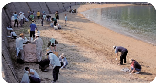
ごみ0クリーンデー（横防海岸）