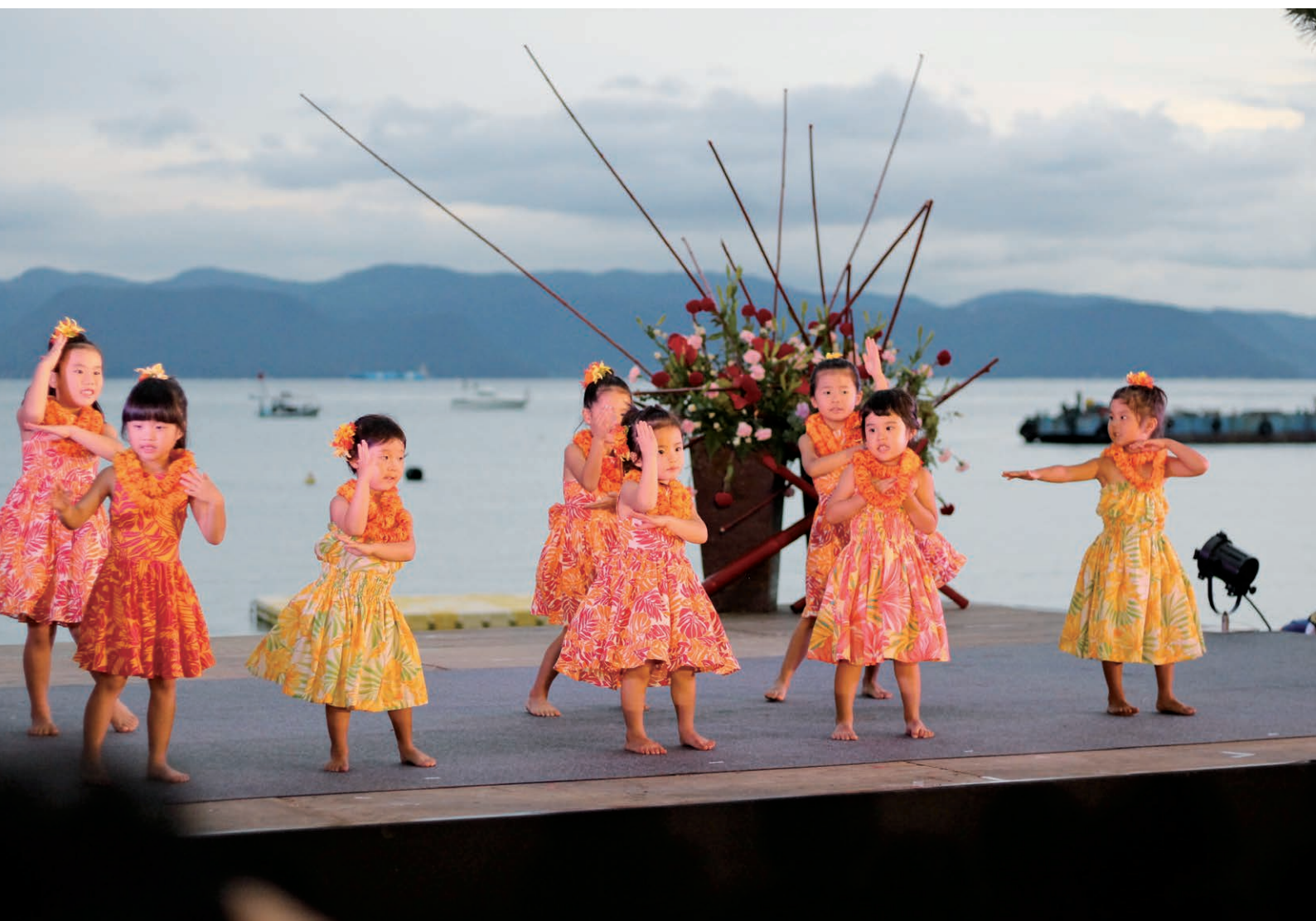
直島ケイキのフラダンスショー（直島の火まつり）

発行●香川県直島町議会 編集●議会広報編集特別委員会 電話●(087)892-2297 印刷●山陽印刷(株)