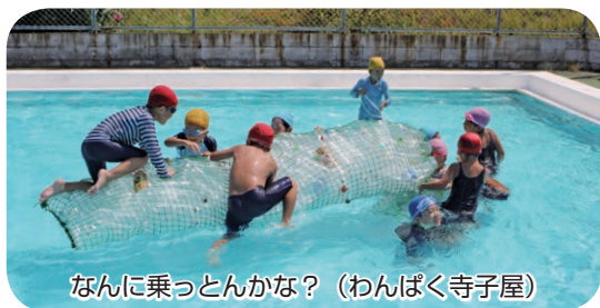
なんに乗っとんかな？(わんぱく寺子屋)