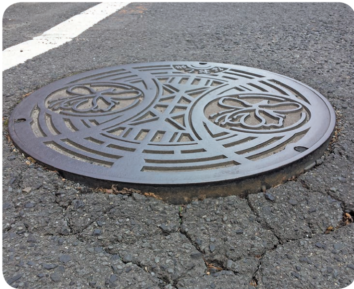
傷みがあり危険なマンホールまわり