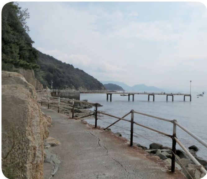
陸からの釣りはできます