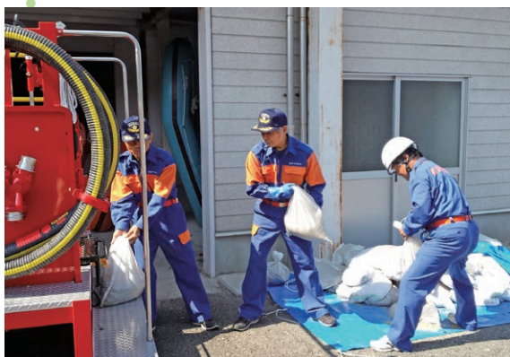
台風接近、土のうを準備中

田 各分団、住民の安全・安心のため力を合わせがらばってほしい。我々も協力します。(全員「同感」の声あり) 新 台風や火事など災害に備え、常日頃の訓練や点検を忘れないよう、がんばってください。 Q 皆様、お疲れさまです。がんばりよりますね、少し話をお聞かせください。