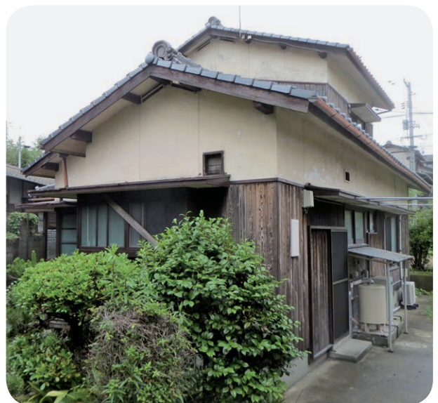
改善策は？ (移住体験住宅)