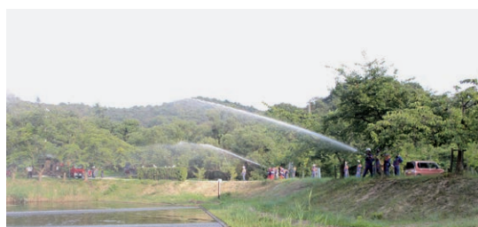
夏季訓練等にも参加します

今日はお忙しいところご協力ありがとうございました。これからも健康で、地域の安全と後輩指導にご活躍をお願いいたします。