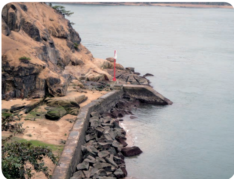
第2海底送水管（陸上部）