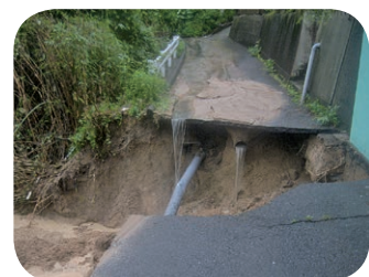
被害があった本村の道路

7月豪雨により町内各所に土砂崩れが発生し、土砂の撤去等を緊急に行なう必要があるため、災害復旧費に1815万円を追加する専決処分を全員賛成で承認しました。