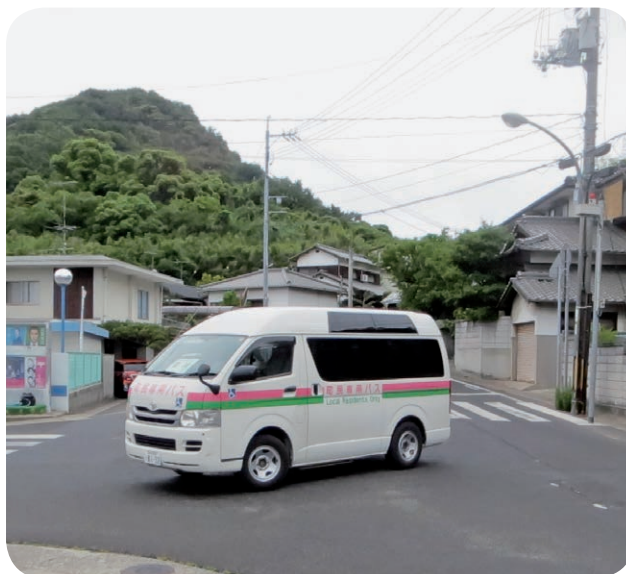
石場町へ小型バスを