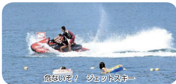
危ないぞ！ ジェットスキー