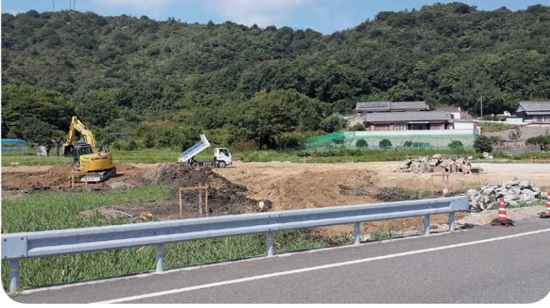
造成工事が始まった積浦地区