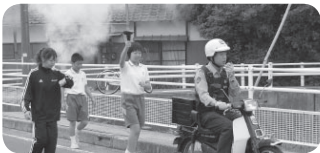
好評だった聖火リレー

A (教育長) 来年は、町民体育祭が第20回ということで、聖火リレーをしてはと思っています。