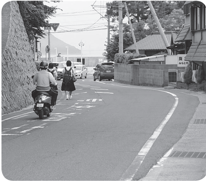
あぶない通学路(宮浦港付近)

○今年の自主防災訓練は7月～秋口頃までに各地区で2時間程度の予定で実施願いたい。