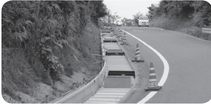
側溝蓋取付工事中の旧南部循環道路（揚島付近）

このコーナーは、議員が以前に一般質問や委員会などで質問した問題が、その後どうなっているかを追跡してお知らせします。