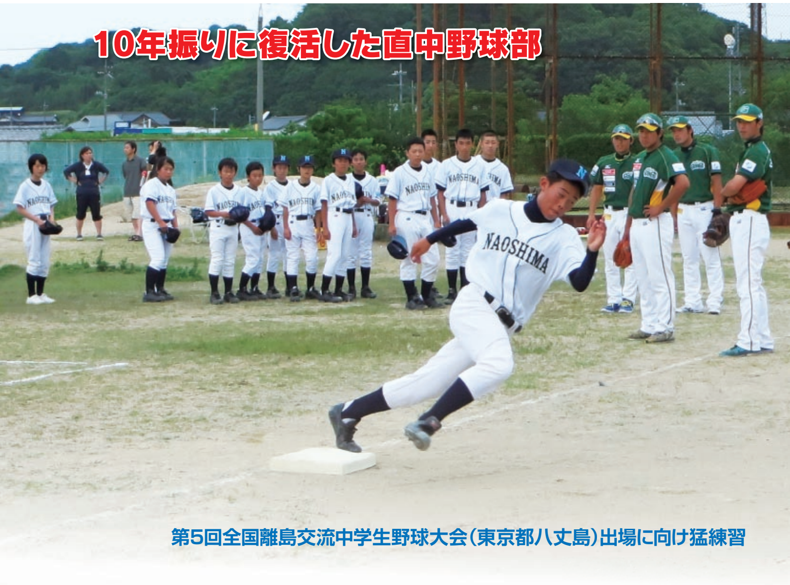
第5回全国離島交流中学生野球大会(東京都八丈島)出場に向け猛練習