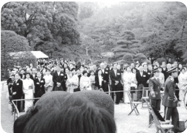
園遊会が行われた赤坂御苑