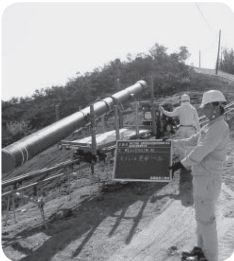
着々と進む送水管布設工事