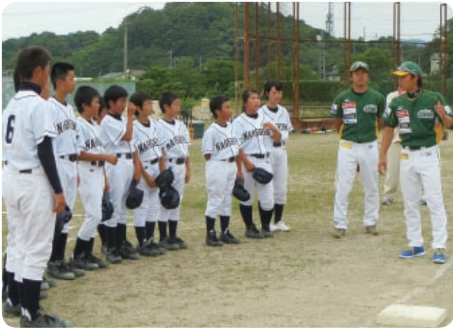
オリブガイナーズの選手からコーチを受けました

練習中におじゃましました。これからもきびしい練習が続くと思いますが、直島魂で試合に練習に挑んで下さい。