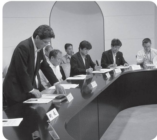
あいさつする工代部長

処理業務の方針変更についての変更に至った経緯の説明後、 ① 同じ水洗浄処理で再度入札する。 ② 水洗浄処理以外の方法を考える。 ③ 豊島処分地で水洗浄処理施設を設置し処理する。 以上3点の今後の対応策について、早期に協議したいと、説明がありました。