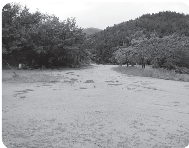
ビオトープ入口付近 (広木池下)

い。夜桜が見られるように電気をつける方法もあり、町が補助をするなど検討している。