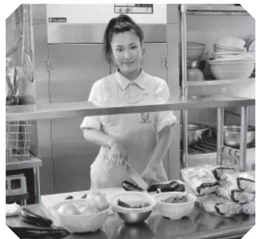
見事な包丁さばき