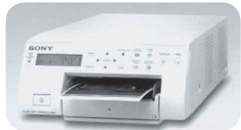
胃カメラ用ビデオプリンター