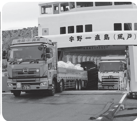
1社になった風戸航路